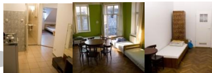
Hostel Trzy Kafki PLUS

Hostel Trzy Kafki PLUS u Krakovu- Smeštaj je u višekrevetnim apartmanima (1/3, 1/4, 1/6 i 1/8). Svaki apartman ima kupatilo i kuhinju. Hostel se nalazi u centru i jedan je od najboljih hostela u Krakovu.